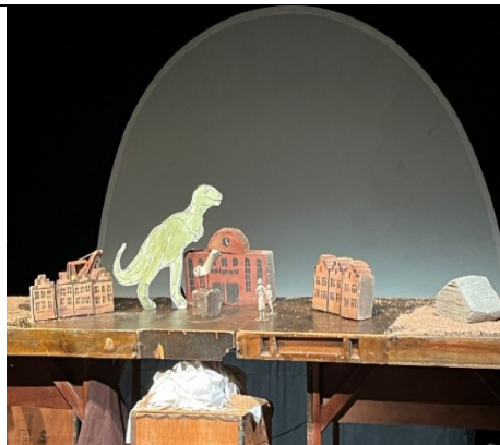
Besuch des Fliegenden Theaters

Die Kinder aus den Klassen 1/2/3 erforschten die 4 Elemente unserer Erde. Jedes Kind konnte einen Tag lang eine Menge rund ums Wasser, die Luft, das Feuer oder die Erde untersuchen.