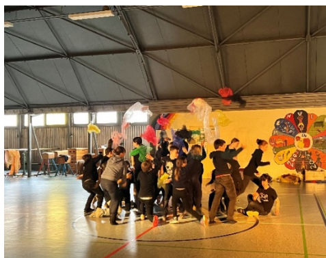
Bewegungstheater 4/5/6 „Vom Urknall zum Roboter“

Die Projektwoche führte uns zu dem Ursprung unserer Erde. Die Schüler:innen untersuchten die Entwicklung des Lebens auf der Erde, reisten in das Innere der Erde oder in die Eiszeit.